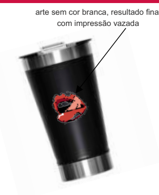
arte sem cor branca, resultado final com impressão vazada

Envie desta forma apenas se desejar que não tenha cor branca em sua impressão. Desta forma, ficará vazado a arte.