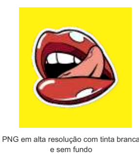
PNG em alta resolução com tinta branca e sem fundo