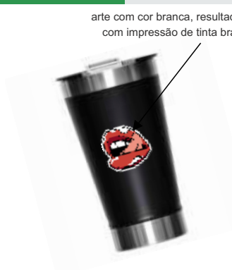
arte com cor branca, resultado final com impressão de tinta branca

Envie desta forma apenas se desejar branco em sua impressão. O fundo deste exemplo foi colocado na cor amarela apenas para visualização da imagem com detalhes branco.